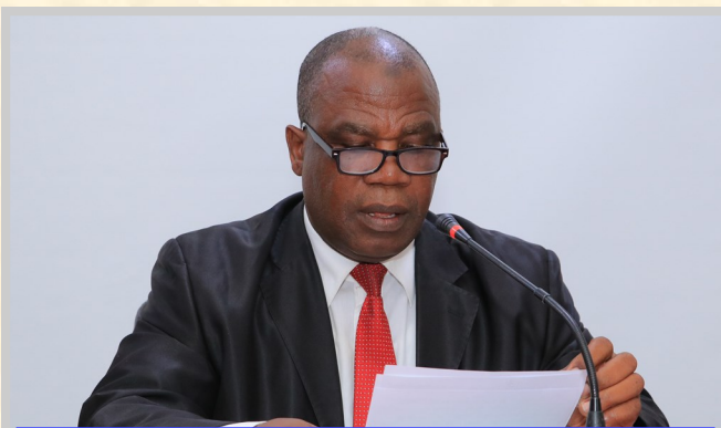
Photo du Vice - Président de l'AEB qui explique l'utilité de l'application "my profile" aux entreprises

En vue de venir en aide aux entreprises qui souffrent de l'injustice de ne pas trouver les profils recherchés mais aussi des coûts élevés liés au recrutement de nouvelles unités, l'AEB a développé sur son site web une application qui réponds efficacement à ce défis.